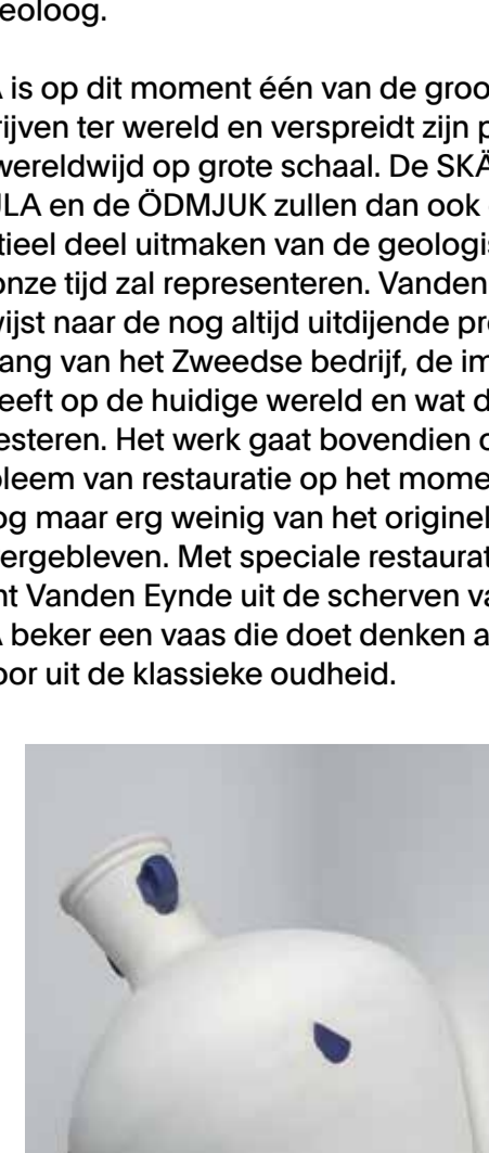
Maarten Vanden Eynde. IKEA Vase, 2010 (aardewerk, reparatiemas). Collectie Zeeuws Museum, aangekocht met steun van de BankGiro Loterij.

IKEA is op dit moment één van de grootste bedrijven ter wereld en verspreidt zijn producten wereldwijd op grote schaal. De SKACK, de SMULA en de ÖDMJUK zullen dan ook een substantieel deel uitmaken van de geologische laag die onze tijd zal representeren. Vanden Eynde verwijst naar de nog altijd uitdijende productieomvang van het Zweedse bedrijf, de impact die dit heeft op de huidige wereld en wat daarvoor zal resteren. Het werk gaat bovendien over het probleem van restauratie op het originele object is overgebleven. Met speciale restauratiepasta vormt Vanden Eynde uit de scherpen van een IKEA beker een vaas die doet denken aan een arfoor uit de klassieke oudheid.