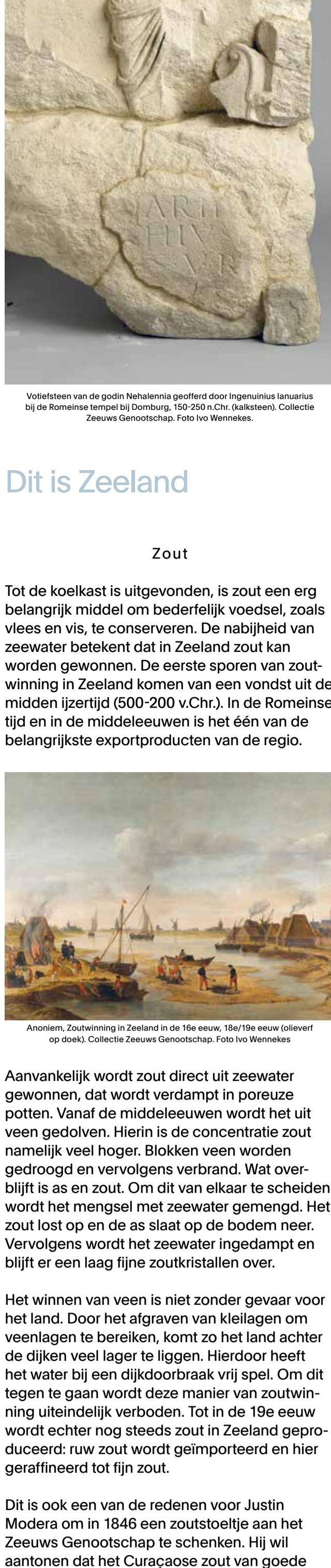
Votiefsteen van de godin Nehalennia geofferd door Ingenuinius Ianuarius bij de Romeinse tempel bij Domburg, 150-250 n.Chr. (kalksteen). Collectie Zeeuws Genootschap.