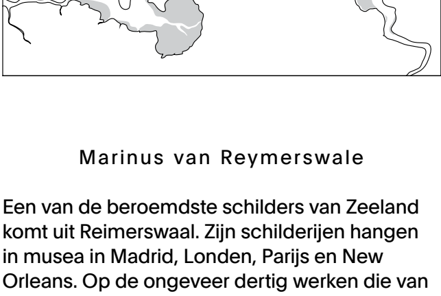
Jan Luyken, Reimerswaal in huidige en vroegere tijden, 1694-1696 (ets op papier).