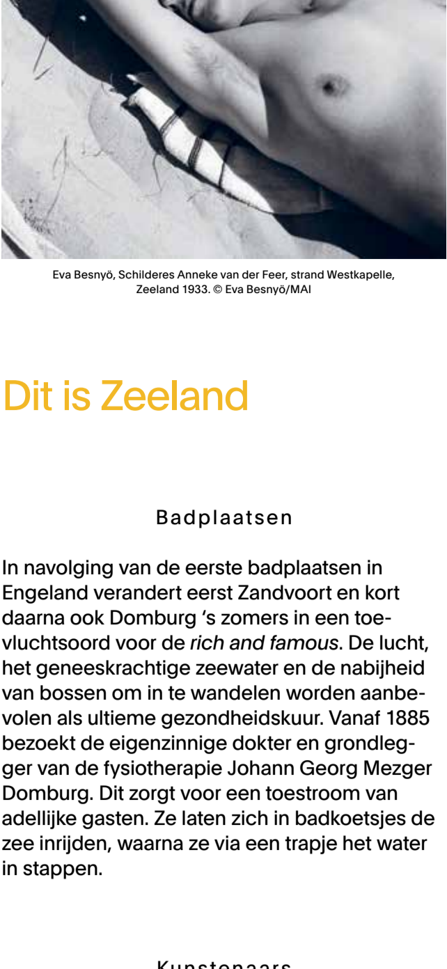
Eva Besnyö, Schilderes Anneke van der Feer, strand Westkapelle, Zeeland 1933.