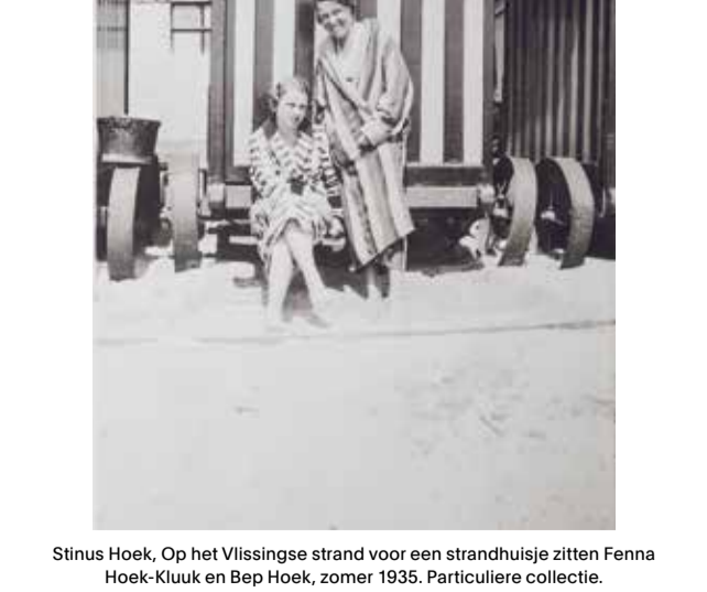
Jaap Scheeren, Noordzee residence, 2017 Collectie Zeeuws Museum

Vanaf de jaren '60 komt het massatoerisme op. Mensen hebben steeds meer vrije tijd. Door de introductie van de 'reisspaarkas' kunnen Nederlanders sparen voor hun vakantie. Al in de jaren '50 komen er ook veel Duitsers in Zeeland vakantie vieren, hoewel ze zich dan vaak voor Zwitsers uitgeven. De oorlog ligt nog te vers in het geheugen. Toerisme wordt een van de belangrijkste bronnen van inkomsten in Zeeland.